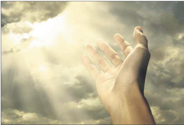
- I min urend over mange kristnes begejstring for Donald Trump bad jeg Gud om hjælp. Jeg fik et syn af Trump som Guds joker. En joker hører ikke rigtig til noget sted, men kan puttes ind forskellige steder efter behov, og ofte i stedet for en anden eller noget andet.

deets hørere: - ellers bedrager I jer selv."