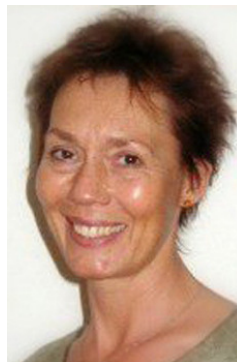
Af Tamarra Bot Uddannet psykoterapeut og prædikant, Zions VækkelsesCenter

Når de forenede sig, ville de opfylde hinanden og blive til et, dette gennem et (af Gud) velsignet ægteskab. Det samme gælder i dag.