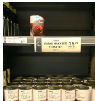
Eventyret om den bulede dåse